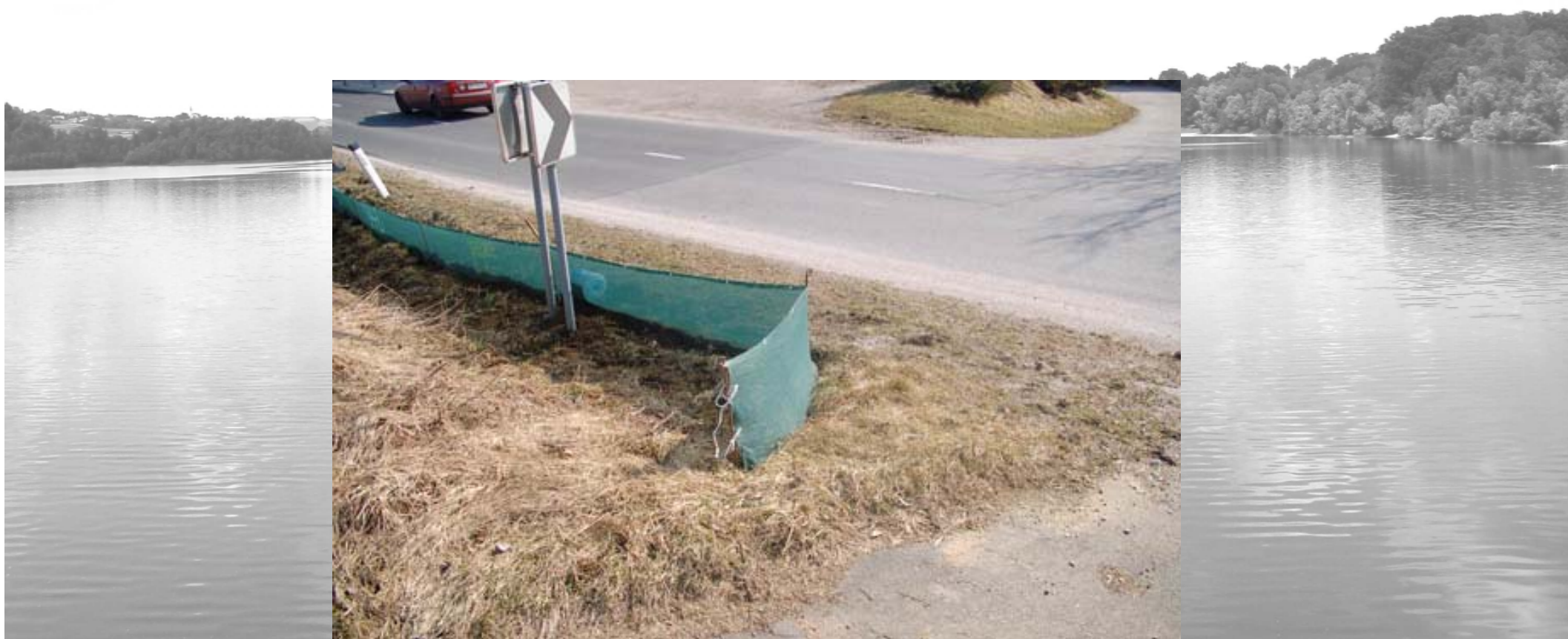
Varstvo dvoživk v regiji Alpe-Jadran-INTERREG IIIA SLO-AT 2000-2006