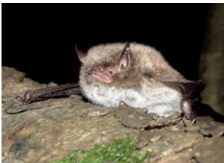
Pozni netopir ( Eptesicus serotinus ) (zgoraj) in obvodni netopir ( Myotis daubentonii ) sta bili poglobilni ciljni vrsti raziskave.

netopirjih in EBLV II predvsem pri obvodnih ter močvirskih netopirjih, vendar so virusa našli tudi pri drugih vrstah netopirjev, kavkazijski lyssavirus pa pri dolgokrilem netopirju. V Evropi so bile v okužbe z EBLV vzrok za encefalitis s smrtnim izidom le pri štirih ljudeh. V zvezi z EBLV je še mnogo neodgovorjenih vprašanj v zvezi z njihovo ekologijo, kljub temu pa je očitno, da je trenutno večina okuženih netopirjev zgoščenih v severni Evropi (npr. na Nizozemskem, v severni Nemčiji, na Danskem). Kako se vedejo z lyssavirusi okuženi netopirji v zadnjih fazah bolezni, si lahko ogledate v zanimivem kratkem filmu na http://www.who-rabies-bulletin.org/about_rabies/Bats/Video.aspx . Film prikaže vse značilne znake okužbe živali: izgubo koordinacije, mišične krče (nezmožnost letenja), izjemno preobčutljivost na zvoke, neizzvano oglašanje, agresivnost – grizenje tudi neživih/nepremičnih stvari.