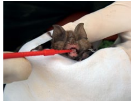
S ščetkanjem smo netopirjem odvzeli bris slin. Na sliki mali podkovernjak ( Rhinolophus hipposideros ).

Opravili smo tudi različna ciljna predavanja (npr. za veterinarje, študente biologije in osebe, ki se ukvarjajo z netopirji) z namenom podati osnovne informacije o netopirjih in njihovih lyssavirusih, da bi slušatelji pridobljeno znanje lahko uporabili pri svojem delu. S tem smo začeli tkati mrežo oseb in organizacij, ki bi v prihodnosti sodelovale pri t. i. pasivnem vzorčenju , kar z drugimi besedami pomeni, da bi se naključne najdbe kadavrov netopirjev posredovale v nadaljnjo analizo. Za seznanitev splošne javnosti je bila v 10.000 izvodih narejena tudi zloženska Netopir, imaš res steklino? , ki so bili večinoma že razdeljeni. Na spletu objavljena zloženska vsebuje številne koristne povezave in nasvete, kaj storiti, če vas je ugriznil netopir ali če ste našli onemoglega oz. mrtvega netopirja.